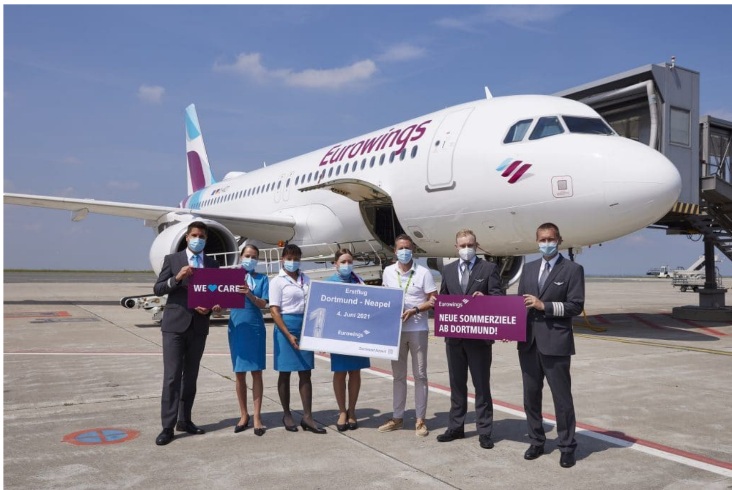
Erstflug nach Neapel, Eurowings 04.06.2021