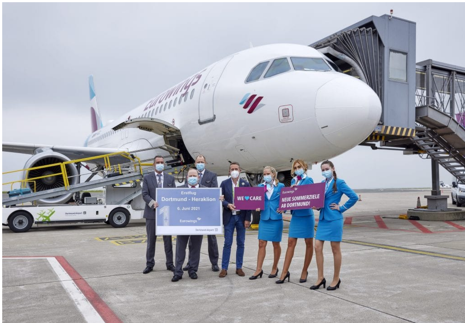
Erstflug nach Heraklion, Eurowings